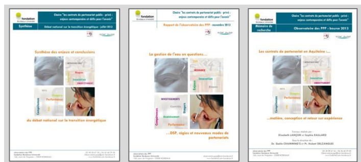
Exemples de productions de l'observatoire