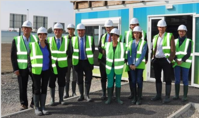
Comité de pilotage du 23 septembre 2014

Durée de la chaire : 5 ans (2010 – 2015)