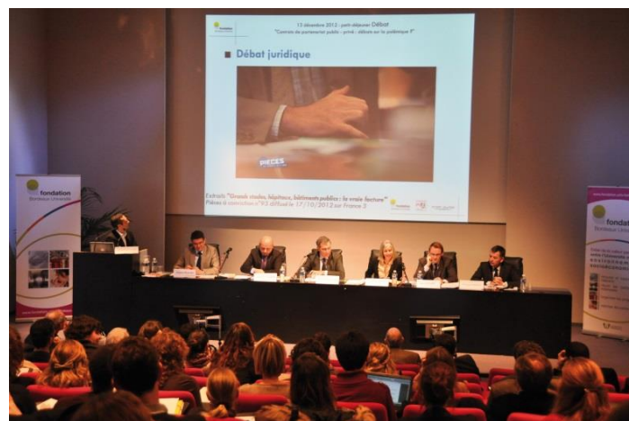
Conférence-débat - 13 décembre 2012